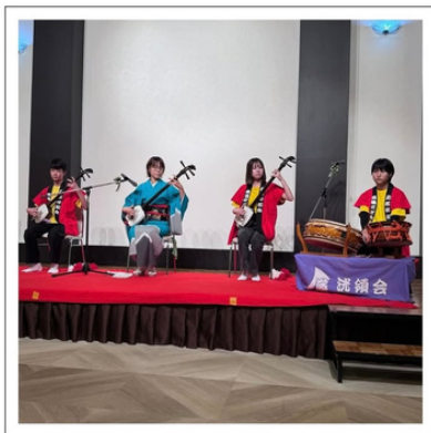
【地域主催敬老祝賀会】

地域によって敬老会も簡素化が進む一方で集う形式も続いています。ご招待いただいた祝賀会では、子ども達の民謡が披露され、ご長寿の皆さんの心に響く温かなひとときとなりました。