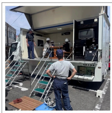
【早岐地区防犯・防災フェスティバル】

地域によって敬老会も簡素化が進む一方で集う形式も続いています。ご招待いただいた祝賀会では、子ども達の民謡が披露され、ご長寿の皆さんの心に響く温かなひとときとなりました。