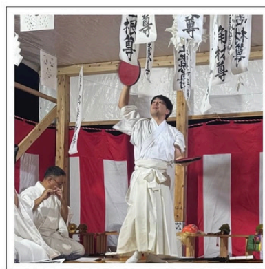
【白岳神社例大祭 平戸神楽】

自助・共助・公助の意識を地域で育むことを目的としたイベントに参加しました。防犯・防災について身近に感じることで、家庭や職場での話題づくりや日常の意識向上につながることを期待します。